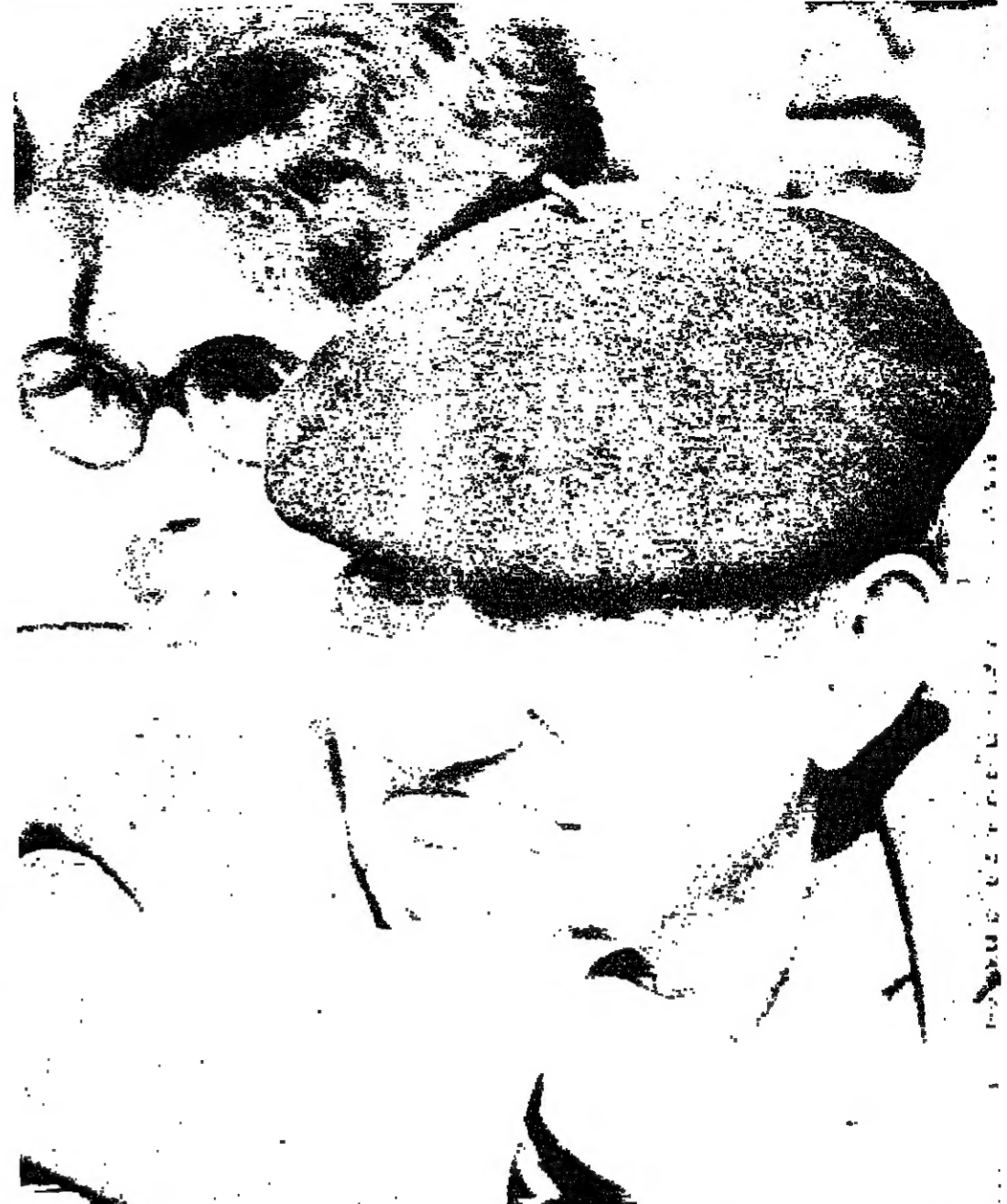
■ المساء على وجه عجوز برتغالي ينظر الى الحق .. ترى هل يعرف مصرع البرتغال